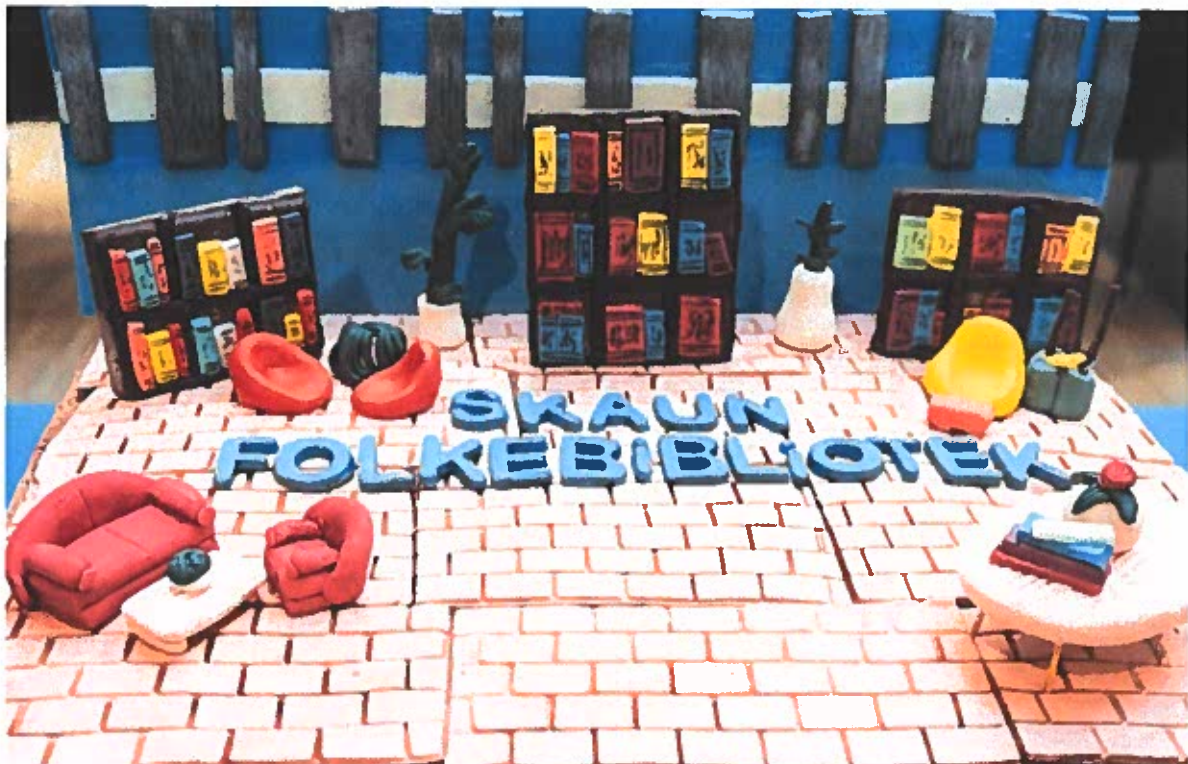
Åpning av Skaun folkebibliotek november 2019